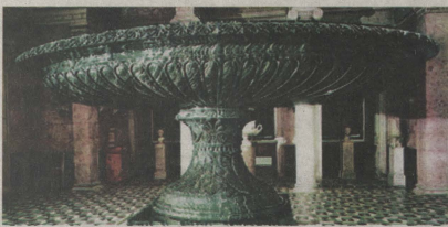
Царь-ваза. Санкт-Петербург, Эрмитаж

Уникальным изделием, выточеным на станках сузунского механика, является знаменитая «Царь-ваза». Заготовка на «царскую вазу» весила не одну тысячу пудов, и огромный, грубообесеченный яшмовый караван из каменоломни на фабрику тащили, впрягаясь в ямку, 406 рабочих людей с окрестных рудников. Путешествие энотиче отутра Ревнолю до Колывани длилось около трёх месяцев. Завё медальное — более десяти лет — шла обработка вазы. Колосальная овальная чаша диаметром 5 метров и высотой 1,5 м попала по сибирским снегам в столицу империи только через восемь лет. В августе 1843 года она была выгружена на набережной у Зимнего дворца, но водворилась в один из специально