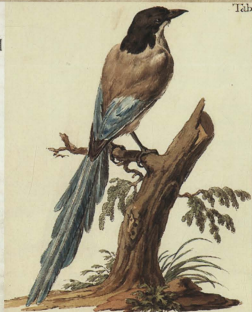
CORVUS Cyaneus ...

П. С. Паллас. Описание растений Россійскаго государства с их изображеніями, 1784 год