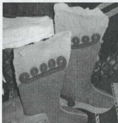
Пимы, расшитые гарусом

В дни Никольской ярмарки население Завод-Сузуна жило совершенно особен-