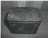
Коробочка из-под чая