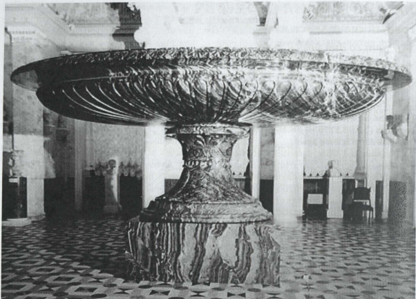
Царица ваз. Коллекция Эрмитажа

произведений из камня. Из них особо выдающиеся — это овальная яшмовая чаша, медальоны «Родомысл» и «Народное ополчение 1812 г.» по моделям графа Ф. П. Толстого, знаменитая «Царица ваз», работа над которой завершилась уже после смерти Лаулина.