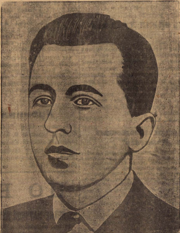
Снимок сделан залогом до ареста.

В 1920 году Престес окончил техникум и был назначен инспектором в железнодорожном батальоне. Работавшего тогда на строительстве стратегических дорог. Не имея военной карьеры, Престес, как страдая бесзащитных солдат, не желая больше покоряться варварскому режиму своих капитанов, в 1924 году встал во главе революционных солдат Сан-Паулу.