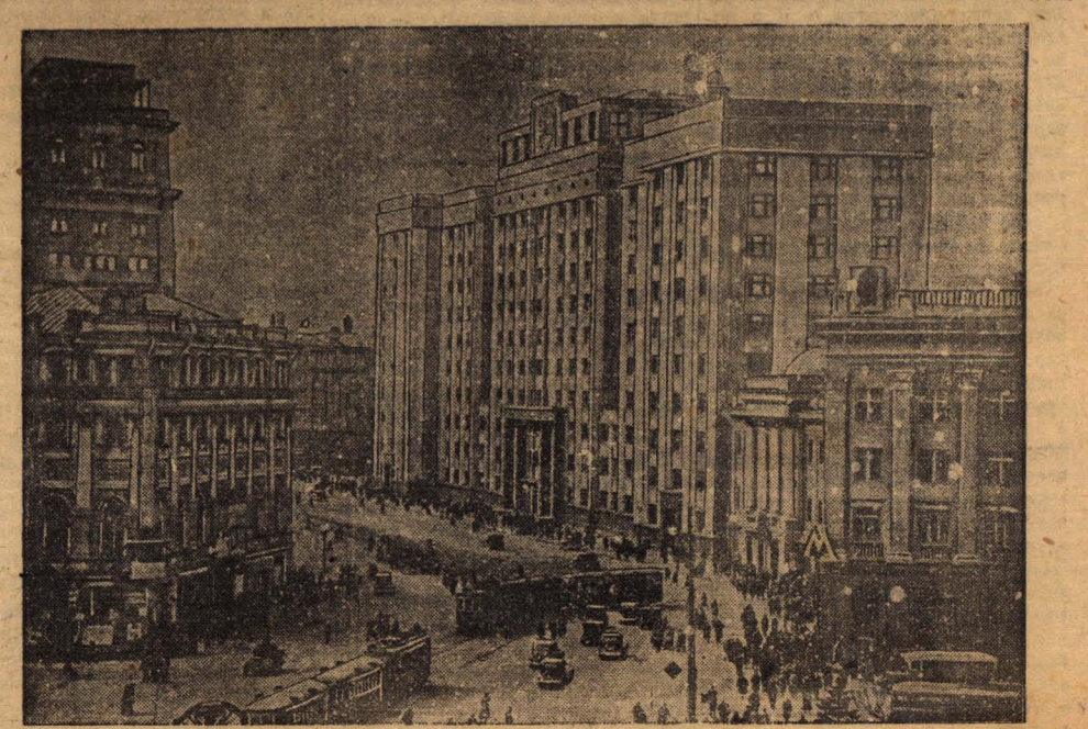
НОВАЯ МОСКВА. На снимке: Дом Совнаркома Союза ССР в Охотном ряду.

Центральное управление народнохозяйственного учета Госплана СССР