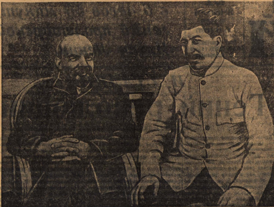
В. И. ЛЕНИН и И. В. СТАЛИН в Горках.

Литературный Марксизм — Онегма — Ленин при ЦК ВКП(б).