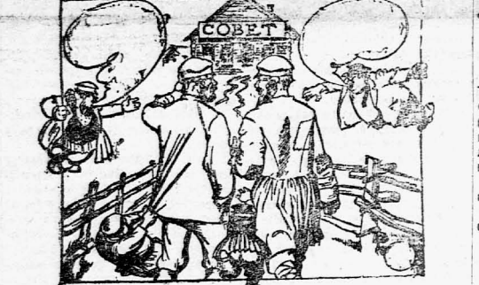
Не бывать кулаку в совете.

ре на восстановление затопленной шахты «Президент», которую решено назвать «Наш ответ Пуанкаре».