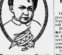
Ленин в детстве (3 года)