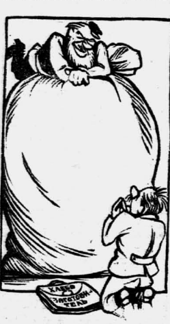
Таким методом хлеб у кулака не возьмешь

Сейчас село Осколково находится в соревновании. Бригада за 4 дня работы провела 12 участковых собраний, общесельские собрания, собрание школьных, выпустила 16 номеров стенок газет «Говорит Рабочий». Кроме того, состоялось бедняцкое собрание в двух посёлках.