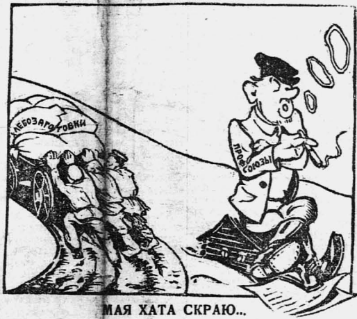
Рис. Сорокина. В ряде мест профсоюзы не участвуют в заготовках (Из писем сельгоров)

Усилить массовую работу Этот новый метод хлебозаготовок требует от нас, прежде всего, исключительно широкого развертывания массовой работы. В ряде мест наши полномоченные как будто отвыкли от массовой работы, как будто бояться крестьянина. Они с крестьянами разговаривают только в порядке администрирования, только в порядке приказа. Они совершенно забывают о массовой работе с беднотой и середняками. В октябре мы должны были полностью взять кулацкий хлеб, применяя, если нужно, административные репрессии, судебные меры возмездия и т. д. В ноябре же мы должны взять в полосу, когда приходится заготавливать законотрафиканный хлеб, середняцкий хлеб, хлеб нашего союзника. Если где-нибудь будет допущено применение методов заготовки при заготовке хлеба у середняков, которые мы применяли к кулаку, это будет лучшей услугой кулаку, ибо кулак ведь и вводу сейчас выступает и говорит: «Я не знаю теперь жму. Обожли, середняки, забирая за тебя возмездия». Если мы по-головопашки будем работать, то будем лить воду на мельницу кулака. Как у нас проводился репрессив