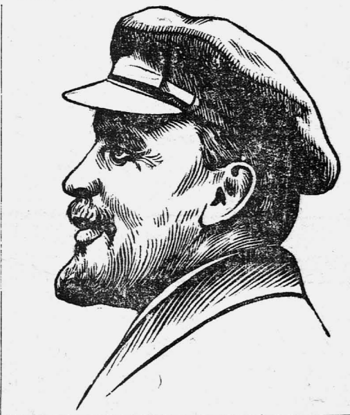
ОБРАЩЕНИЕ В. И. ЛЕНИНА К НЕЗАМОЖНЫМ СЕЛЯНАМ

Мы вступили в новую полосу решительной борьбы за социализм. Да здравствует пятилетка — план и великая работа по строительству социализма.