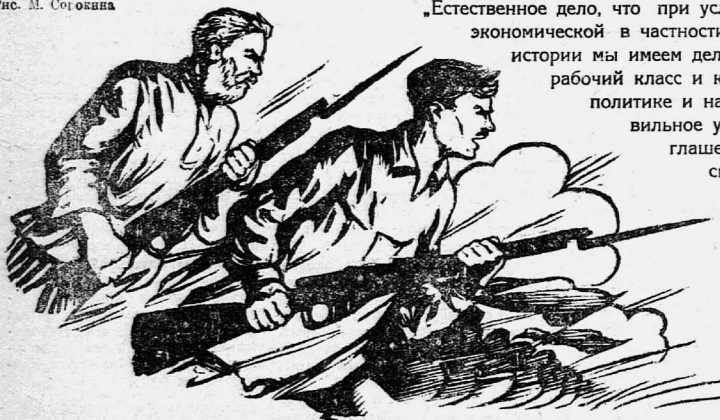
Рис. М. Соколкина

«Естественное дело, что при условии громадного преобладания крестьянского населения, нашей главной задачей—и политики вообще, и политики экономической в частности—является установление определенных отношений между рабочим классом и крестьянством. В первый раз в новейшей истории мы имеем дело с таким общественным порядком, когда класс эксплуататорский удален, но когда мы имеем два различных класса—рабочий класс и крестьянство. При громадном преобладании крестьянства—это преобладание не могло не отразиться на экономической политике и на всей политике вообще. Главным вопросом для нас остается—и в течение долгого ряда лет неминуемо останется—правильное установление отношений между этими двумя классами, правильное с точки зрения уничтожения классов. На формуле соглашения рабочего класса и крестьянства очень часто останавливаются и очень часто пускают ее в ход против нас враги советской власти, потому что сама по себе эта формула совершенно неопределенна.