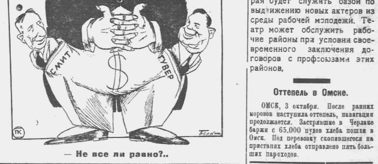
— Не все ли равно?..

Главная борьба на предстоящих 6-го ноября выборах президента САСШ ведется между кандидатами: республиканцем — Гувером и демократом — Смитом. Оба они ставленники крупного капитала. Некоторые банкиры и промышленники финансируют одновременно выборную кампанию обеих партий. (Из газет).