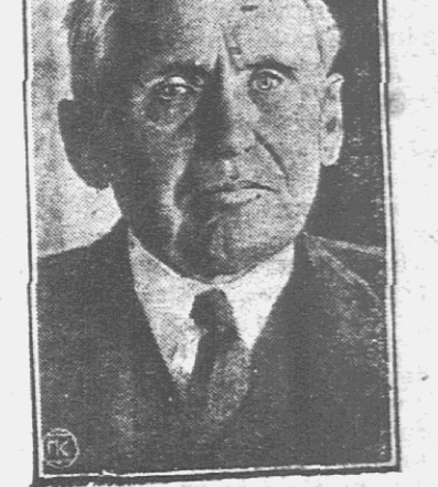
На снимке: Френсис Келлог, государственный секретарь (Мин. Иностр. Дел) САСИИ.

Из передовой «Известий», переданной по телеграфу.