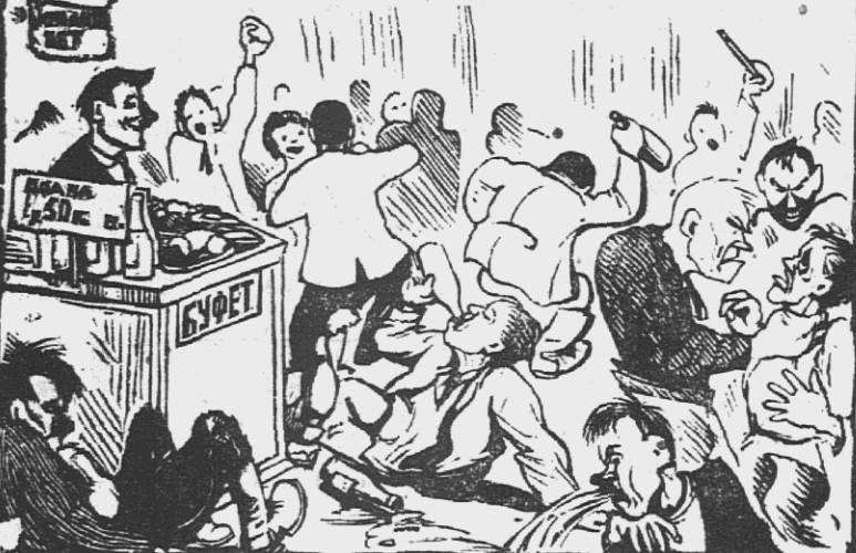
Номера сверх программы.

Рик уплатил этому сокровищу из самоубийства 309 рубльков. Председатель Рика и секретарь Райкома строку посетил ввозили несколько раз. Важно, «портфельно», я с кем не разговаривал и милье все го, конечно, с «медкой сошкой» — учителем. — Мы сами решим, что здесь делать нужно,—важно вырекли эти два мужа и... до сих пор решают.