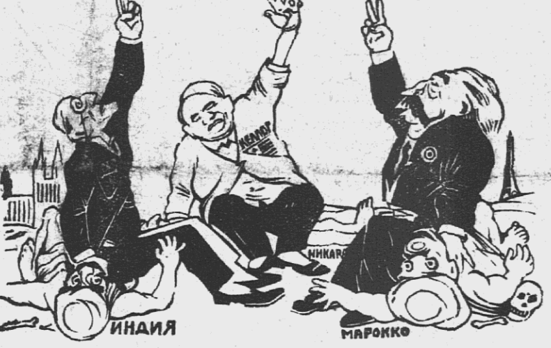
—Клянемся пактом не вести никаких войн, кроме тех, которые мы уже ведем и будем вести.