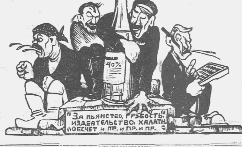
«За пьянство, разврат, издевательство над работниками, обесчест и пр. и пр. и пр.»

И вот, головоотыство администрации заставлял парня обращаться в РКК, загрузка же делая, не стоющим внимания. Будет ясно как день работал, так и выдана за то, что получают все, исполняя эту работу. Нетеграфист.