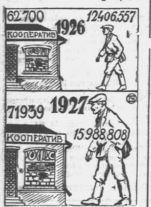
Слева число кооперативных лавок в 1926 и 1927 г.г. Справа число членов в потребительск. кооперации в 1926 и 1927 г.г.