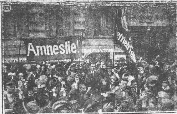
Рабочие Германии пользуются всяким поводом, требуя освобождения из тюрем политических заключенных. Недавно прибыли в Берлин из Москвы 5 рабочих делегатов Иенского завода Цейса. Берлинские рабочие встретили их бурной овацией. На снимке демонстранты несут плакат с надписью «Амнистия»