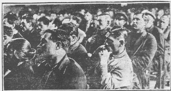
На снимке—делегаты съезда слушают доклад.