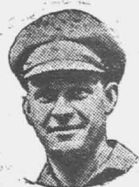
Секретарь германской компартии тов. Тельман.

Смотр боевых сил германского пролетариата прошел под лозунгами: борьба против опасности войны, против фашизма, за защиту СССР.