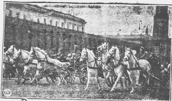
Тачанки на первомайской демонстрации.