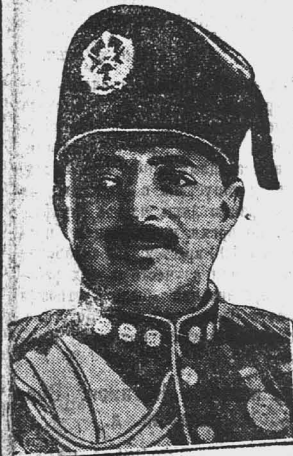
(К его пребыванию в СССР.)