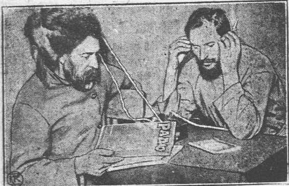
Радио на селе.

По всему видно, что Белоярские кресткомы энергично выдвигают за проведение весенней сельско-хозяйственной кампании. А. Г.