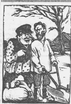
Кулак: Поменьше сей! Все равно толку мало от посева. Бедняк: Нищи себе дураков в другом месте.