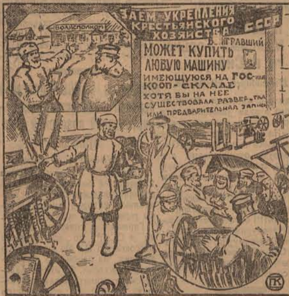
Итоги работы по займу. Кто отказывается от приобретения займа. (о. Харьков, Павловокого района).