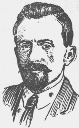
Доклад т. Лозовского на конгрессе Профинтерна.