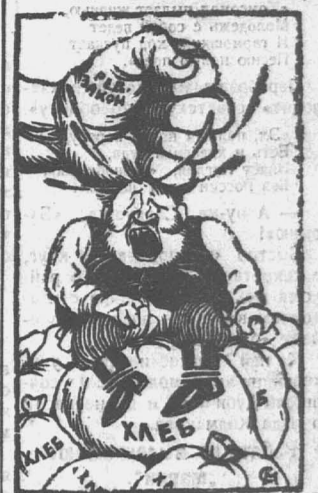
задерживающим хлебные излишки в целях спекуляции.