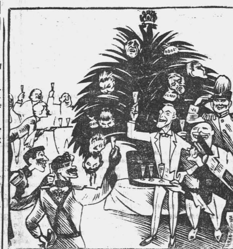
Елка у Чемберлена.

Типограф Беле, арестованный в связи с делом фабрики фальшивых черновцов во Франкфурте на Майне, освобожден из под ареста. Следствие по его делу продолжается.