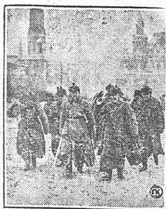
Группа командиров, принимающая парад войск ТПУ на Красной площади в Москве. Впереди справа — Зам. Пред. ОГПУ т. Г. Ягода.