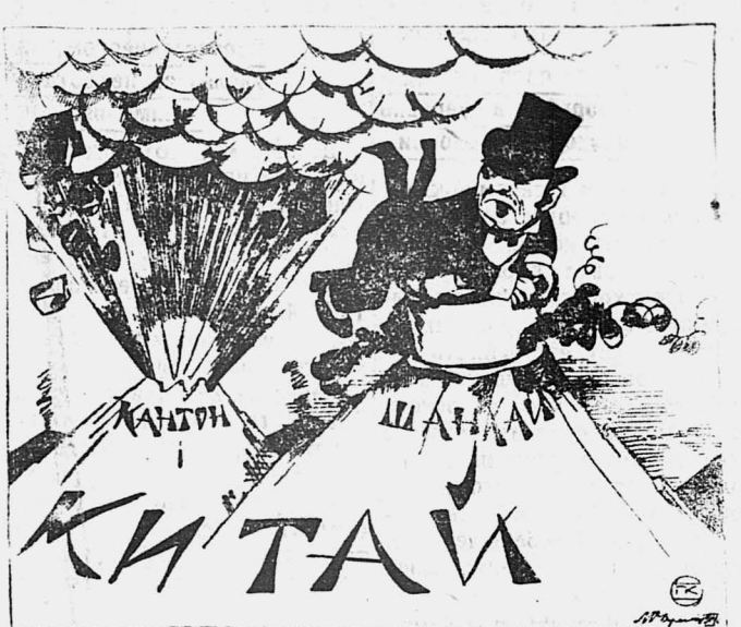
Затруднительное положение империализма.

Умер Сазонов. Париж, 26 декабря. По сообщению агентства «Гавас» в Нише умер бывший министр иностранных дел царского правительства Сазонов.