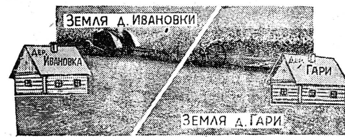
Снимок 2. Расположение земель деревни Ивановки и деревни Гари после обмена землями.