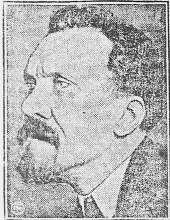
Москва, 19 декабря.

В докладе определены главные линии хозяйственной работы в течение ближайших пяти лет.