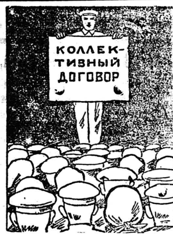
Дружно обсудим проекты колдоговоров.

В прошлом мы имели случаи, когда конфликты возникали по таким беспорядочным вопросам, как запрещение увольнения беременных женщин без разрешения инспекции труда, а так-