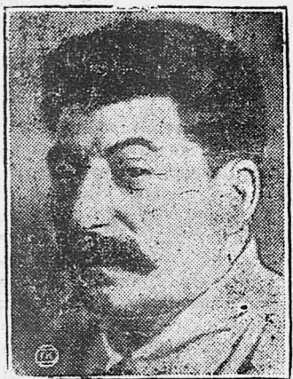
Москва, 5 декабря.

Передаем краткое содержание доклада т. Сталина.