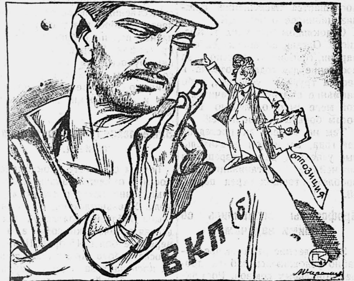
Наш ответ троцкистам.

«Теперь оппозиции конец, крышка, не надо нам теперь оппозиции!» (Ленин).