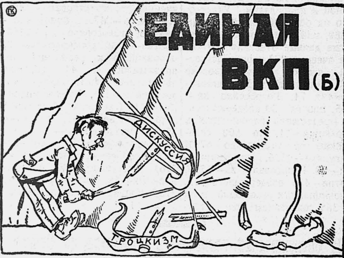
Под знаменем ленинского единства пришла ВКП(б) к 15 съезду.

34 партия матча Алехин и Капабланка отложена после 81 хода. Алехина можно считать новым чемпионом мира, ибо Капабланка заявил, что он, вероятно, сдаст 34 партию.