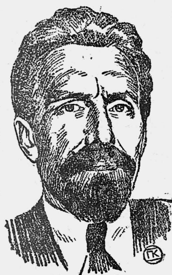
МОСКВА, 19. Даем доклад т. Рыкова о международном и внутреннем положении СССР на заседании сессии ЦИК от 15 октября.

Доклад т. Рыкова о международном и внутреннем положении СССР.