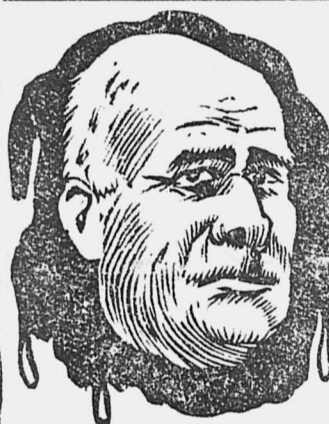
Детердинг, глава компании, ведущей борьбу против советской нефти.

ПАРИЖ, 9. Печать приводит сведения из официальных источников, по которым из Парижа в Москву Эрбетту послана нота для передачи Чичерину. Нота, по словам печати, содержит формальное требование об отзвании Раковского, приводя в качестве основания следующие три мотива: подпись Раковского под декларацией оппозиции, заявление Раковского и передача последних советских предложений в прессу без предварительного министерства иностранных дел, ибо этот факт был истолкован, как обращение к общественному мнению во Франции, а следовательно, как некорректность.