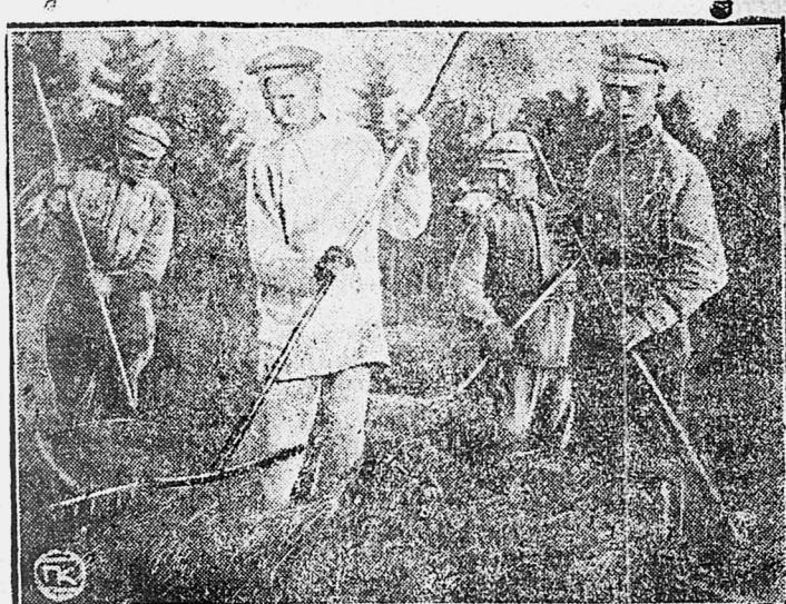
Красноармейцы на маневрах помогают крестьянам по уборке сно с поля.