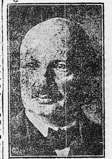
Адвокат и журналист, член «левого» блока, председатель комиссии по подготовке материалов для возобновления сношений с СССР.

В кампании французской правой прессы против СССР де-Монзи выступает против разрыва и против высылки тов. Раковского из Франции.