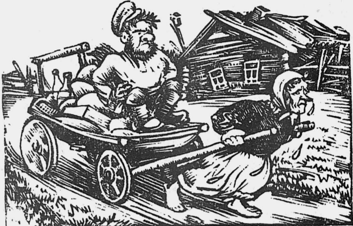
— Вези, вези, старуха, а придет срок уплаты ссуды — тебя с торгов будем продавать.

Бедняк д. Змазевой Акатьев, полученную ссуду на покупку лошади, израсходовал на покупку товаров. (Из письма).