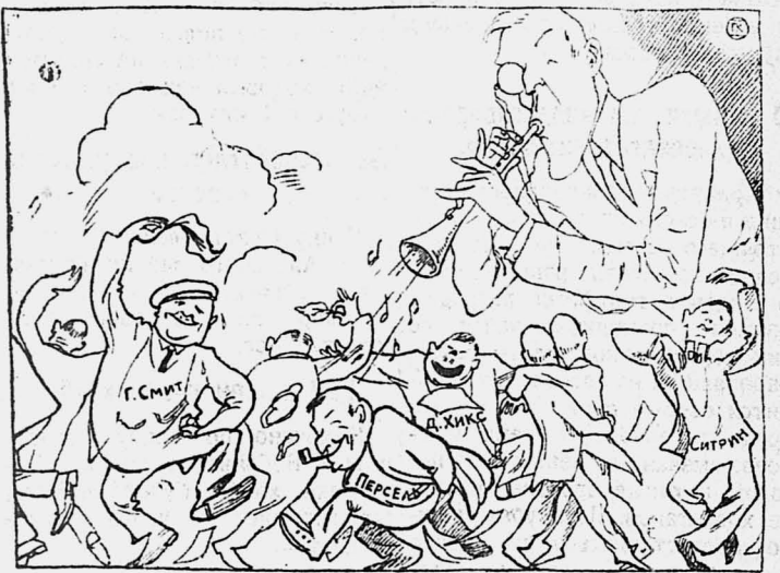
Общий вид Эдинбургского конгресса тред-юнигов.