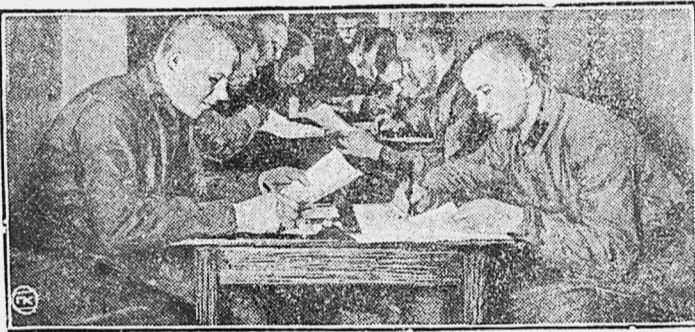
Красноармейцы в часы отдыха в красном уголке.

Один из лучших сельсоветов по явке на пункт призыва — Июшевский сельсовет.