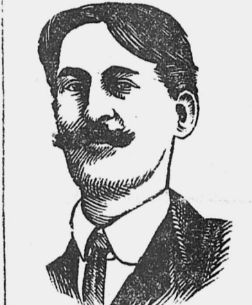
Известный французский писатель Анри Барбюс, приехавший в Москву.

ТОКИО, 12. Агентство «Симбун Ренго» сообщает, что 11 сентября, в 8 часов 47 минут утра, советский летчик Шестаков вылетел из Ташикавы в обратный путь через Осаку. Шестакова сопровождают аэроплан газеты Токио «Асахи» и несколько военных аппаратов. Проводить Шестакова прибыли представители военных и гражданских властей, токийский губернатор, представители авиационных обществ, учащаяся молодежь, отдельные летчики и много народа. Проводы имели самый сердечный характер.