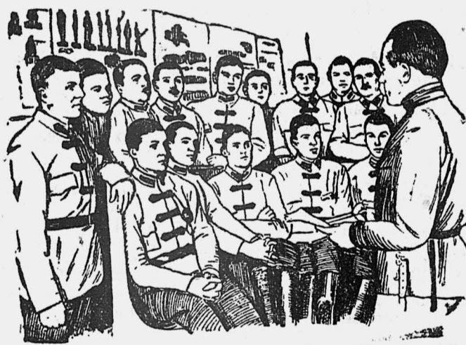
Политчас у красноармейцев.