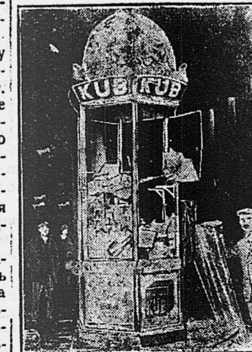
Разбитый рекламный киоск на улице Парижа.

В пятницу, 9-го сентября, в 6 часов вечера, в помещении комклуба созывается внеочередной пленум ОК ВКП(б), на который должны явиться все члены и кандидаты ОК. Повестка дня будет объявлена особо. Ответ. Секретарь ОК ВКП(б) Яппин.