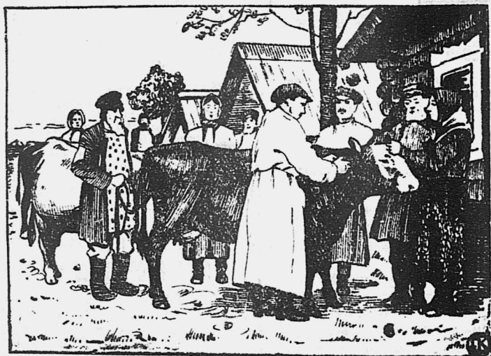
Осмотр врачом молочного скота.