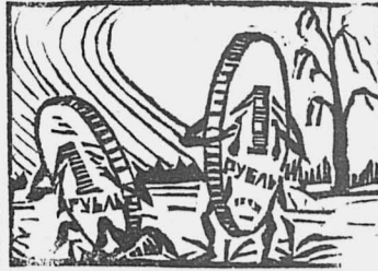
Деньги, которые прикарманит пред...

Шелаболихинский РИК в мае месяце ассигновал 90 руб. Старо-Обинцевскому сельсовету на оборудование пожарного обоза и сарая. Сарай сделали возле сборки под одной крышей, но пожарным обозом не обзавелись. Тридцати Старо-Обинским лошадям, бычкам и телкам повалилась прохладная темнота сарая и они устрили здесь свой клуб. Можно себе представить, что из этого получилось: духота, вонь, оводы, мухи.