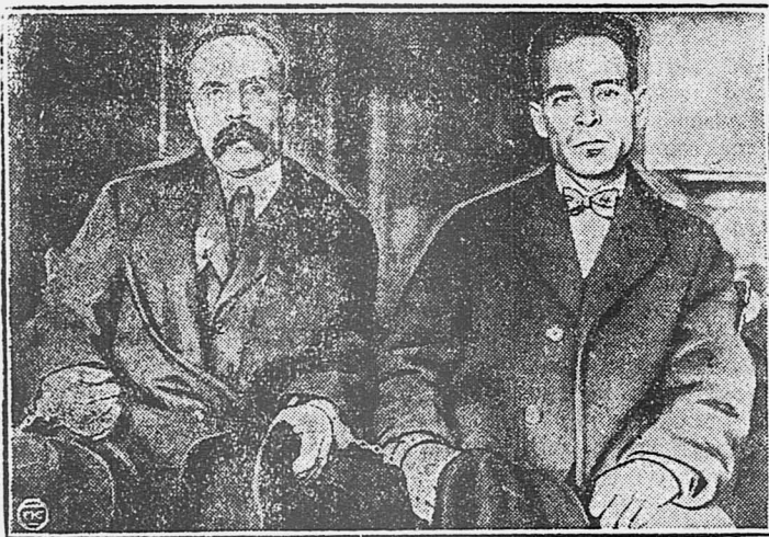
Узники капитала Сакко и Ванцетти, казненные в ночь на 23 августа.

Скоро сентябрь месяц, возобновляйте подписку на газету „КРАСНЫЙ АЛТАЙ“.