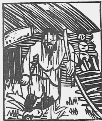
а председатель сельсовета из комнаты мокрый.