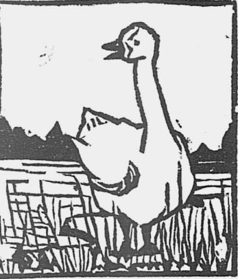
Гусь из воды выходит сухой.

Хорош у нас в селе Долговеком председатель сельсовета, хорош, как гусь! Только бывает он каждый день пьян. (Из письма селькора).