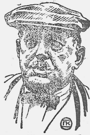
Один из лидеров

ПАРИЖ, 29. Открылась организованная амстердамским интернационалом международная конференция женщин-работниц.