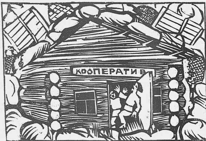
В таком состоянии находятся некоторые кооперативы.