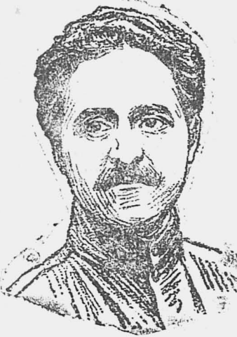
Орджоникидзе, доклад о работе ЦКК ВКП и НКРКИ СССР пленуму.

На вечернем заседании пленум заслушал доклад Ярославского, а также прения по докладу Затонского. На вечернем же заседании с заключительным словом выступил Затонский. Для окончательной разработки резолюции по докладу ЦКК КПУ и НКРКИ УССР образована комиссия.